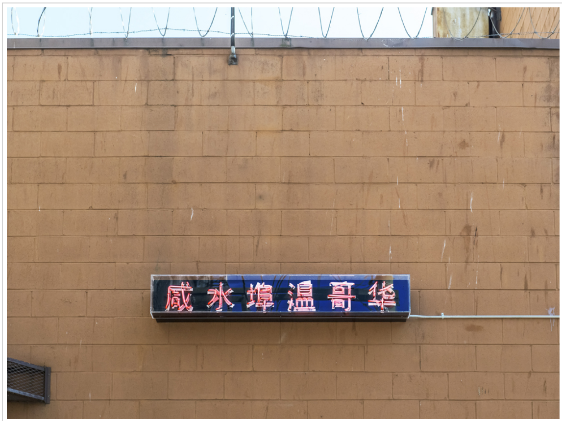
Image: Paul Wong, "Saltwater City Vancouver/鹹水埠溫哥華," 475 Main Street (alleyway), 2020

A new neon artwork by Paul Wong honouring the history of Cantonese migrants now illuminates 475 Main Street.